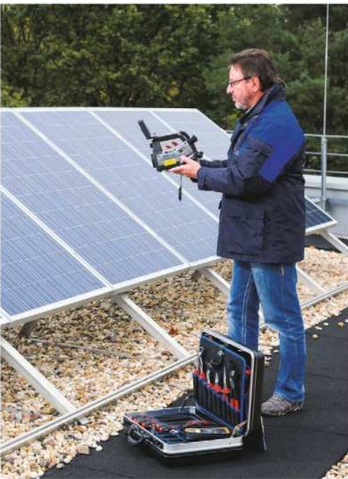
Abb. 4.5: Die vorsorgende Inspektion der Solarmodule auf Korrosion und Hotspots gehört zur regelmäßigen Wartung. Mit Hilfe von Fotos und thermografischen Aufnahmen werden Risiken und potenzielle Brandherde rechtzeitig aufgespürt.

Einzelne Solargeneratoren haben zwar schon gebrannt. Doch angesichts von deutschlandweit mehr als 1,5 Millionen Anlagen ist kein erhöhtes Brandrisiko durch Photovoltaik erkennbar. Brände entstehen, wenn sich in den Solarmodulen sogenannte Hotspots ausbilden. Das sind lokale Fehler in den Zellverlötungen (Zellstrings), in denen aufgrund von defekten Kontakten sehr hohe Übergangswiderstände und damit Temperaturen auftreten können. Vorbeugender Brandschutz beginnt demnach mit der regelmäßigen Kontrolle des Modulfelds auf Hotspots (siehe auch Abschn. 1.2.5.3). (Abb. 4.5)