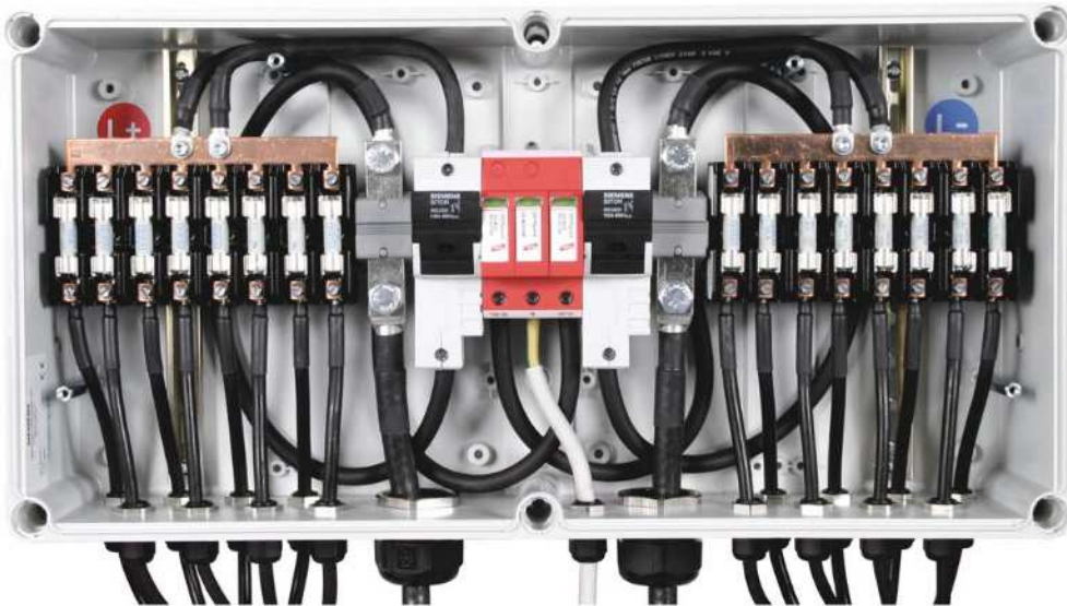
Abb. 4.3: Anordnung von Überspannungsschutzschaltern im Generatoranschlusskasten eines Solar-generators. Die Schutzschalter sichern die Generatorhauptleitung (DC) gegen Überspannung, bevor sie ins Gebäude geführt und an den DC-Eingang des Wechselrichters angeschlossen wird.