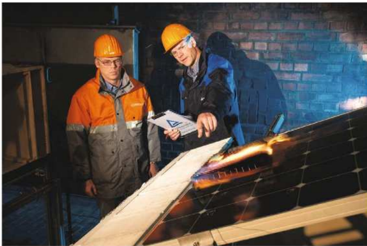
Abb. 4.6: Rund 200 Brandfälle mit Photovoltaikanlagen hat der TÜV Rheinland systematisch analysiert. In zahlreichen Tests wurden die Ursachen für Brände ermittelt, um die Schutzvorschriften zu verfeinern.